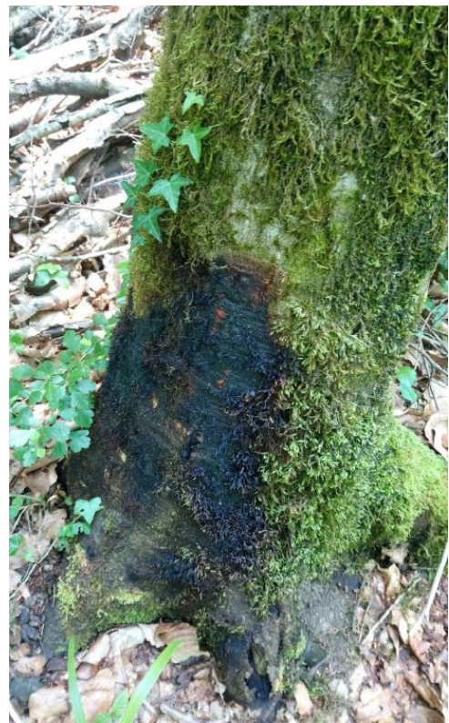
Nécrose à phytophthora à Cunfin (10) – A. Pizzinga

Enfin, une attention particulière est également portée à la détection des Phytophthora (tests souvent réalisés in-situ, grâce au procédé Elisa). Pour l'heure (avec seulement 12 cas déclarés pour les trois dernières années), le problème est jugé mineur, mais les stress à répétition subis par les hêtraies pourraient favoriser le développement de ce pathogène.