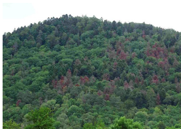
Rougissement de sapin en FC de Rupt/Moselle (88) - B.Didier

Remiremont). Sont également concernés des reboisements de Haute-Marne et de Meuse.