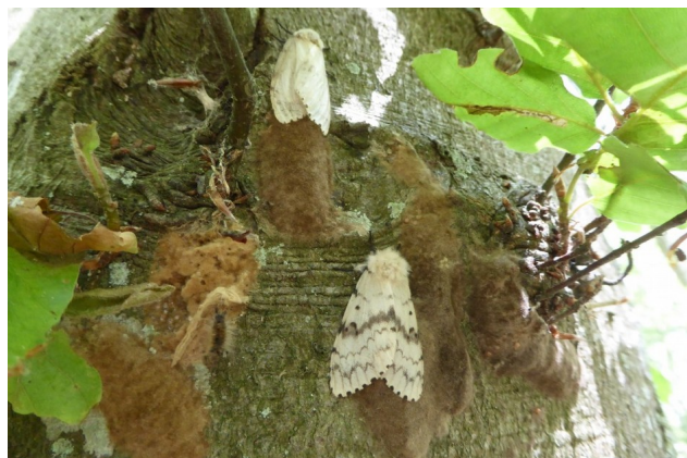
Femelles de Bombyx disparate en cours de ponte, Haboudange (57) le 24/07/2019 - M. Gillette

Cependant, les symptômes de dépérissements déclenchés par le climat peuvent survenir plusieurs années après l'événement proprement dit. Aussi, pour tenter d'appréhender ce phénomène, un nouveau protocole de surveillance des dépérissements des chênaies est mis en place à compter de l'hiver 2019/2020 (enquête nationale).