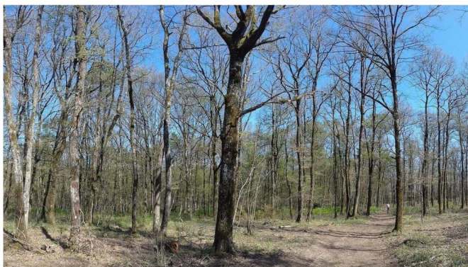
Chêne défolié en juillet 2019 à Etain (55)

Le bombyx disparate , dont on surveille l'extension, a été observé à plusieurs endroits (plaine d'Alsace, l'est de la Moselle, sporadiquement en Meurthe-et-Moselle...) ; confirmant l'augmentation des populations dans l'est de la région Grand Est. Son principal foyer nouveau a été repéré en Moselle, avec plus de 50 hectares défeuillés dans la région de Château-Salins.