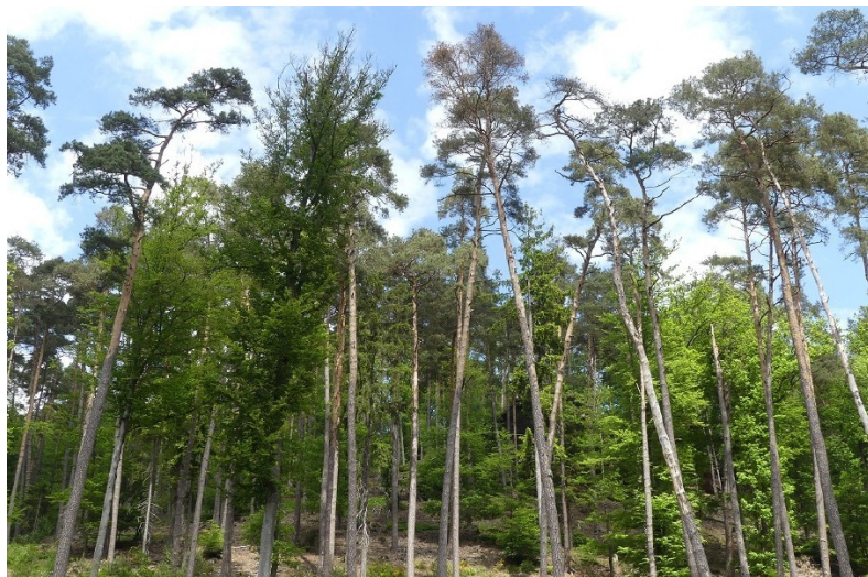
Mortalité de Pin sylvestre en forêt de Goendersberg (57) en mai 2019

Enfin, le foyer alsacien connu depuis 2008 (Obernai, en milieu urbain) est persistant, malgré la lutte, sans pour l'instant contaminer les massifs forestiers alentours.