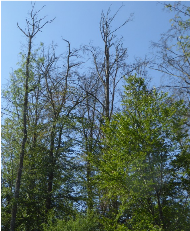
Dépérissement de hêtre à Lidrezing (57), le 24/07/2019 – M. Gillette

Dès le printemps, des symptômes inquiétants apparaissent dans les hêtraies. On constate des absences de débourrement ou des débourrements partiels (en lien également avec le gel de mai 2019), des écoulements corticaux, une mortalité de branches anormale (avec ou sans fructification 2018), de la microphyllie et des déficits foliaires parfois préoccupants.