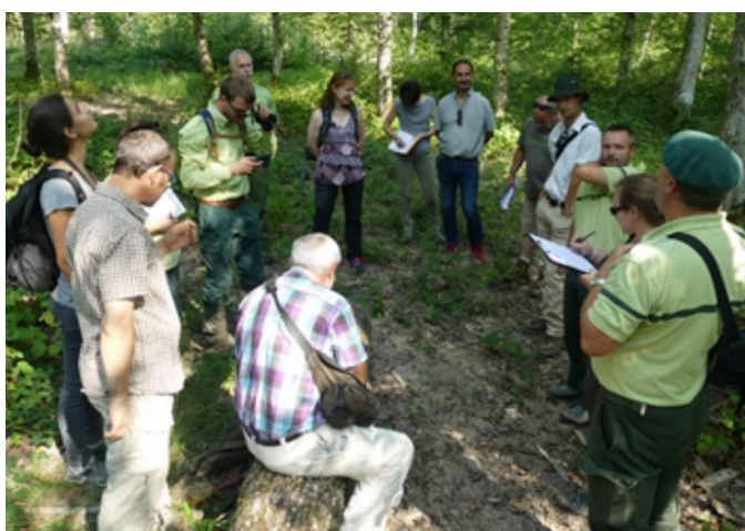
Tournée « Guide de gestion de crise à Fénétrange (57), le 27/08/2019 – R. Pierrel