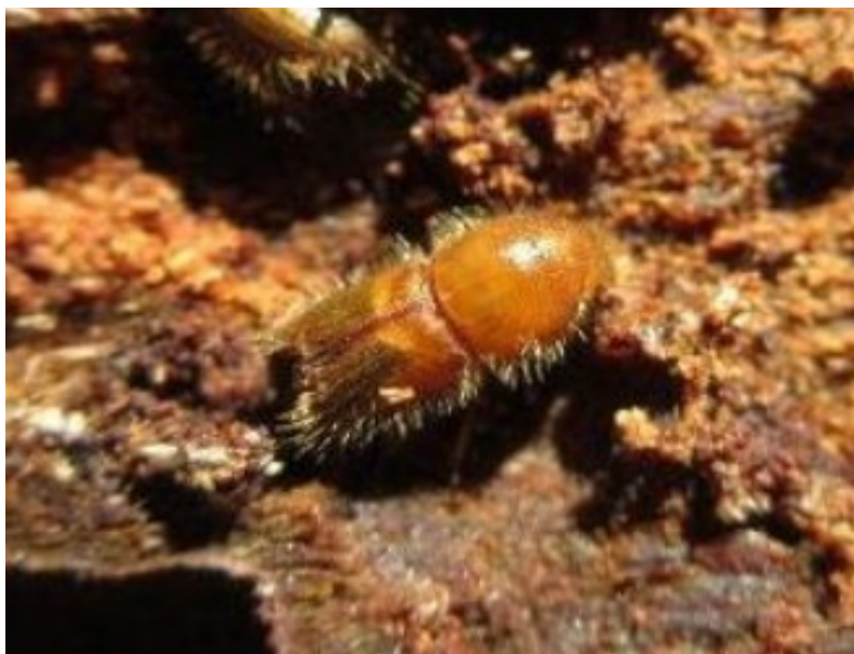
Immature « couleur paille » de typographe (88)

Suite à des sollicitations de l'interprofession (démarche partagée GE et BFC), un premier régime d'aides à l'exploitation et la commercialisation des bois scolytés est acquis fin 2019 (pour un montant de 6 M€). Il est suivi par un second volet, portant cette fois-ci sur un soutien au renouvellement des peuplements impactés (pour un montant de 10 M€).