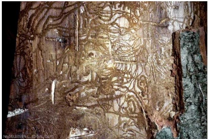
Tronc de frêne écorcé par un pic montrant les galeries d'hylésine crénelé - Ephytia

Toutefois, même si la chalarose est affaiblie cette année, elle continue son œuvre (en forêt publique, passage de 63 800 m 3 de frêne récoltés en 2018 à 100 600 m 3 en 2019) et l'avenir de nombreuses jeunes frênaies, régénérées de façon naturelle ou par plantation, reste illusoire.