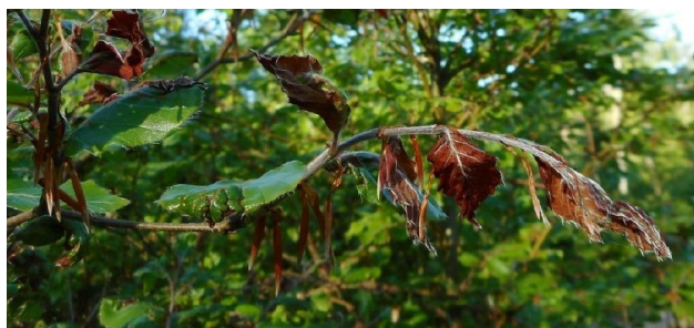
Dégâts de gel tardif sur fourré de hêtre, F.D Tannières (88) le 22/05/2019

Le flux de nord, établi début mai, s'accompagne d'une forte chute des températures et le retour de gelées tardives (et de petites chutes de neige) qui impactent les peuplements forestiers. Localement, ce sont principalement les chênaies et les hêtraies qui sont endommagées, avec des signalements de dégâts sur le feuillage. De plus, les plantations de l'année n'échappent pas à ce phénomène climatique et présentent, pour 23 % d'entre elles (toutes essences confondues), des dégâts de gel lors du premier passage de notation au printemps.