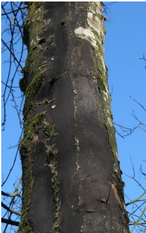
Symptômes caractéristiques de la maladie de la suie en F.C de Châtenois (88)

Enfin, notons deux cas d'attaques massives de bombyx disparate, constatés sur peupliers dans la Marne.